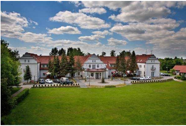
III) Urlaubsort am Mikorzyn See,