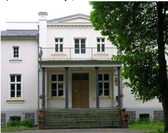
V) Schloß von Łąd,