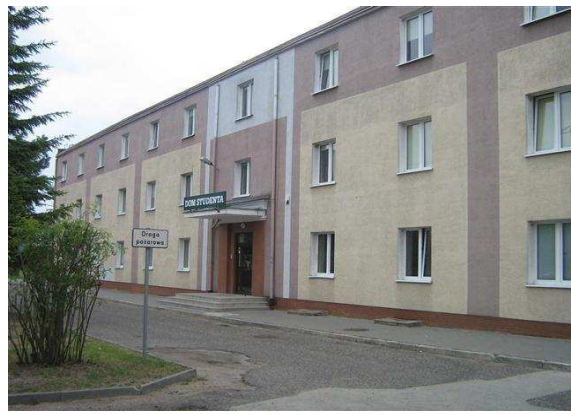
IV) Studentenwohnheim im Konin,