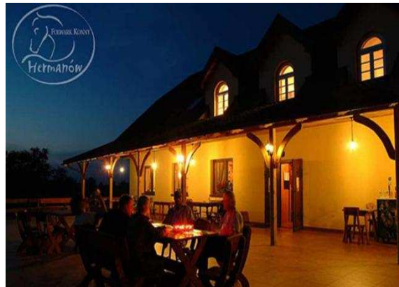
VI) Pferdegstüt in Hermanów.