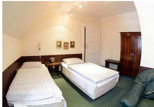
VI) Schloß in Małydy,