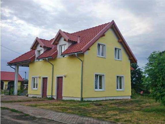
V) Privatquartier in Krosno,