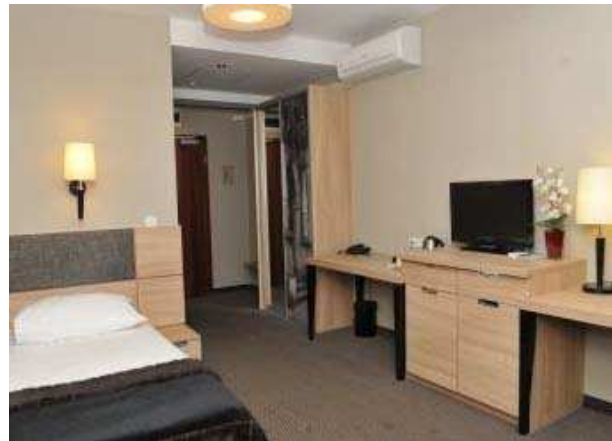
IV) Hotel in Elbląg,