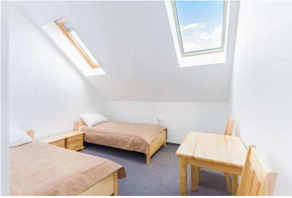
I) Marina in Grudziądz