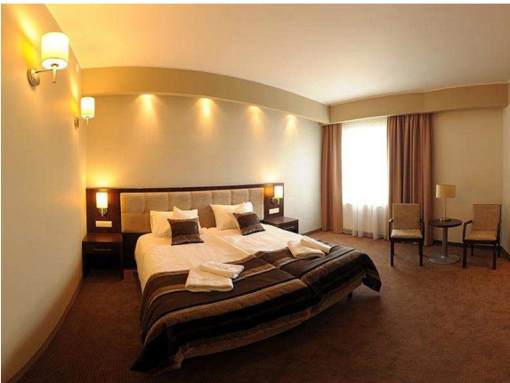
III) Hotel in Marienburg,