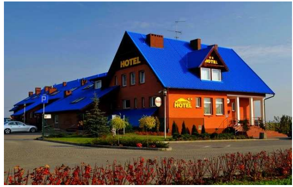
II) Hotel in Gniew,