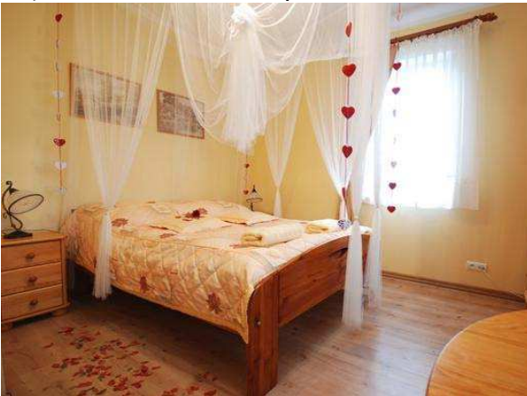
VII) Hotel neben Miłomłyn,